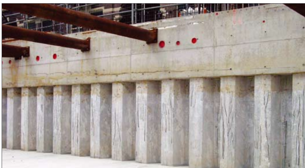
↑ Figuur 9 Aanzicht van de afgewerkte SCB-wand