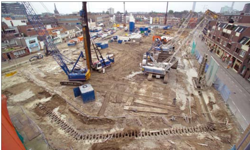
↑ Figuur 1 Overzicht van de bouwplaats

In Nederland zijn geen normen beschikbaar