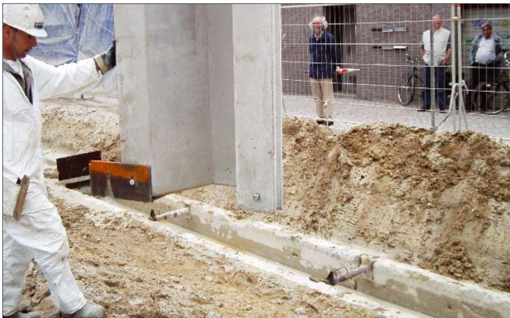
↑ Figuur 6 Detail geleidingssysteem

Voor aanvang van het werk is er in een laboratorium een uitgebreid vooronderzoek gedaan met diverse mengsels en samenstellingen. Voor het mengsel was een karakteristieke druksterkte vereist van 1,5 N/mm 2 . Om deze karakteristieke sterkte te halen, moest de representatieve waarde minimaal 2,0 à 2,1 N/mm 2 bedragen. Het mengsel moest ook een