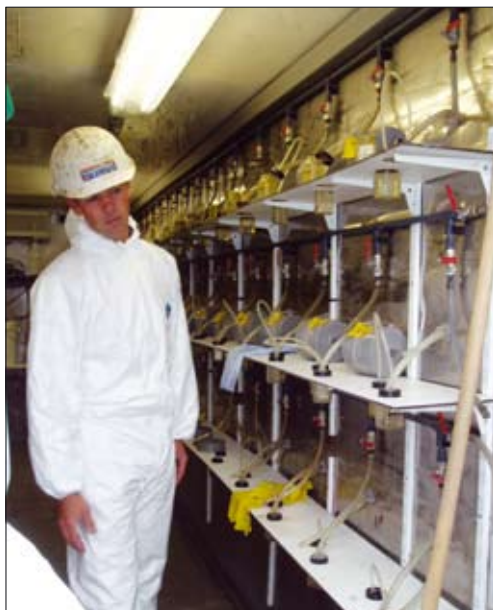
↑ Figuur 5 Laboratoriumcontainer voor geschiktheidsonderzoek en kwaliteitscontrole

een nauwkeurigheid van 1% haalbaar geacht. Bij een ontgravingsdiepte van 45,0 m kan een paneel onderin 0,45 m verlopen zijn. Wanneer twee naastgelegen panelen beide een maximale scheefstand hebben, maar in tegengestelde richting, dan kan de maximale afwijking 0,9 m bedragen, zodat de panelen bij een dikte van 0,8 m in theorie niet meer op elkaar aansluiten.