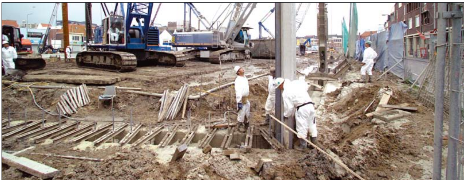
↑ Figuur 4 Het ontgraven van de sleuf en het afhangen van de Spanwand®

en diepte, het volumieke gewicht van de steunvloeistof, de grondwaterstand, het steunvloeistofniveau en tenslotte de locatie en grootte van eventuele externe belastingen. Omdat de afstand tot en de funderingswijze van de belastingen variëren, zijn meerdere berekeningen uitgevoerd. Aangezien niet alle informatie met betrekking tot de belastingen in detail beschikbaar was, is er in dit geval voor gekozen om gezamenlijk een aantal relevante doorsneden te definiëren en deze door te rekenen.