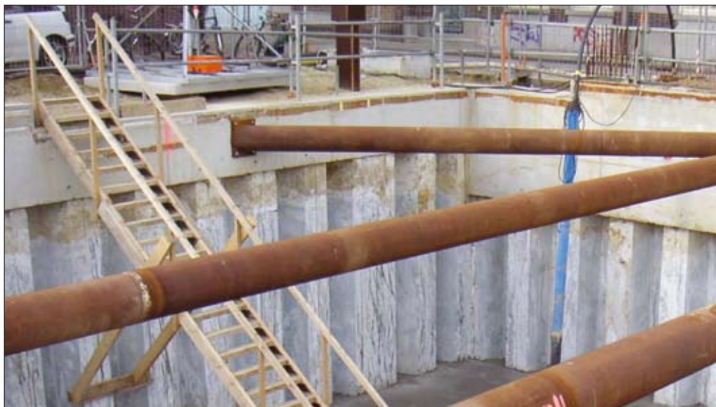
↑ Figuur 8 Resultaat van de uitvoering van de SCB-wand