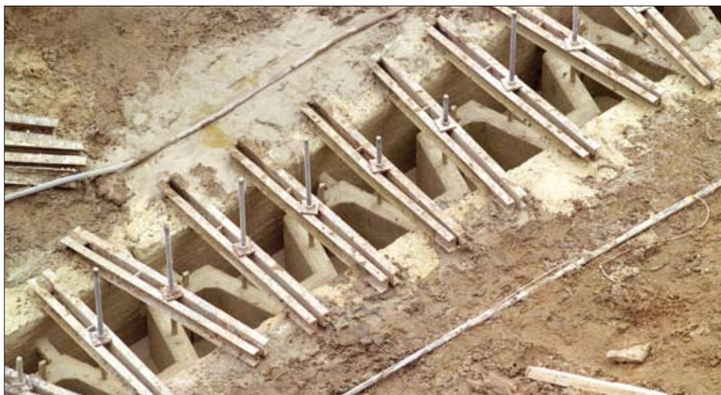
↑ Figuur 7 Detail afhangsysteem

Reacties op dit artikel kunnen tot 1 april 2007 naar de uitgever worden gestuurd