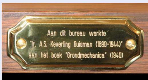
Figuur 4 Het bureau van Keverling Buisman.

this kind might be held in Holland, if Holland desires to invite the conference'. Dat excellente werk kwam tot uiting in het grote aantal publica- ties van Nederlandse auteurs in de Proceedings van het eerste congres, waaronder een aantal zeer belangrijke, zoals die van Keverling Buisman over 'Long Duration Settlement Tests', waarin zijn seculaire zettingen werden gepresenteerd, en een van het Laboratorium voor Grondmecha- nica over de verschillende beschikbare test- faciliteiten, waaronder het celapparaat. Na afloop van de conferentie, waarbij van Neder- landse kant helaas alleen ir. J.L.A. Cuperus van de Nederlandse Spoorwegen aanwezig was (voor de anderen waren de reiskosten vermoedelijk te hoog), schreef Terzaghi, die tot eerste President van de nieuwe International Society of Soil Mechanics and Foundation Engineering was benoemd, lovende woorden aan Keverling Buisman en aan Van Mourik Broekman over de Nederlandse bijdragen aan de conferentie, met het verzoek inderdaad de volgende conferentie te organiseren. Overigens kenden Terzaghi en Keverling Buisman elkaar goed, onder andere