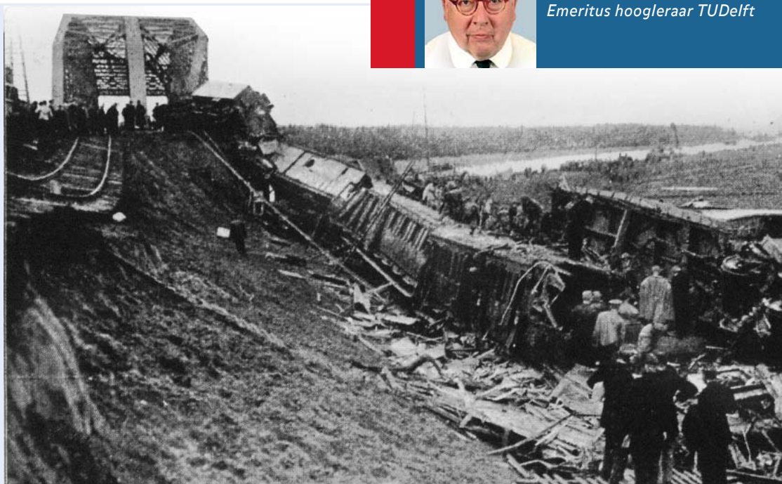
Figuur 1 Het spoorwegongeluk bij Weesp, 1918.

Als de grondlegger van het vakgebied van de Grondmechanica in Nederland geldt algemeen Prof. ir. A.S. Keverling Buisman. In dit artikel wordt een kort overzicht gegeven van zijn leven en werken, met de nadruk op zijn bijdragen aan de ontwikkeling van het vakgebied.