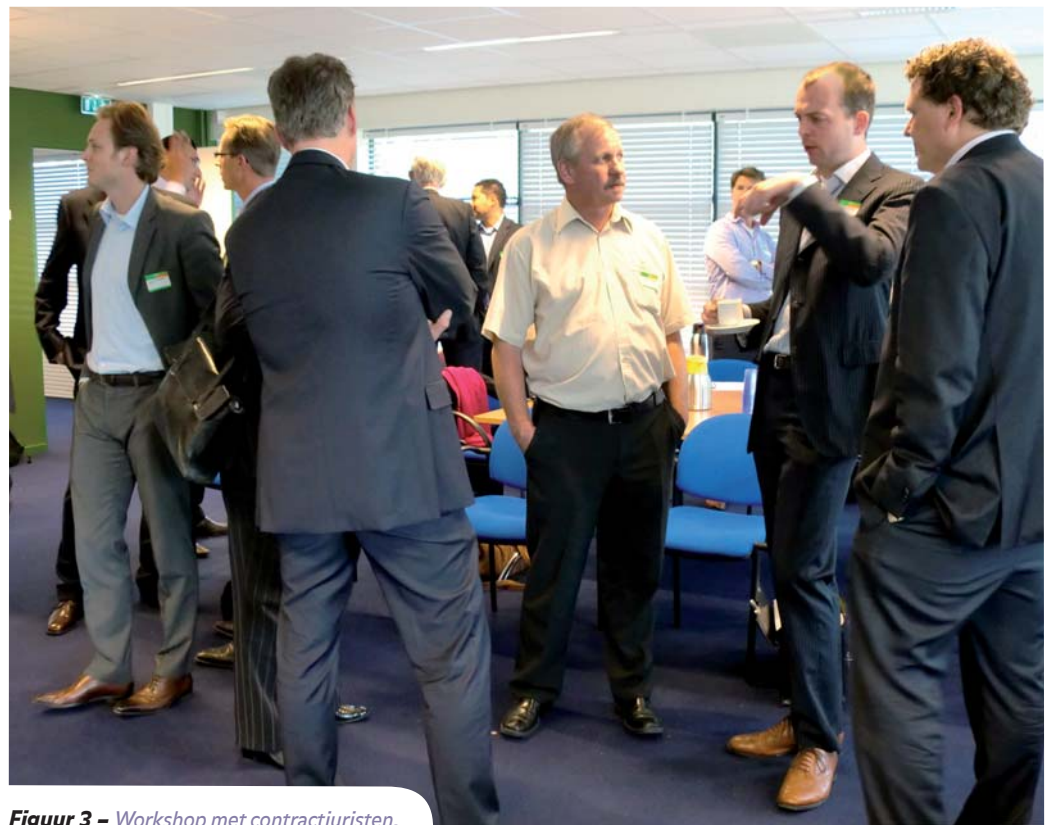
Figuur 3 – Workshop met contractjuristen.

worden betrokken bij het ontwerp. De geotechnische informatie – nodig om risico's in te schatten – wordt daarbij echter door verschillende partijen tijdens de verschillende projectfasen verzameld. Het probleem dat zich hier voordoet is dat per projectfase de benodigde informatie niet altijd op het juiste moment voorhanden is. Daarbij is het bovendien door de gegeven ontwerpvrijheid niet altijd mogelijk om voor alle ontwerp oplossingen dekkende informatie te verzamelen. Dit maakt het